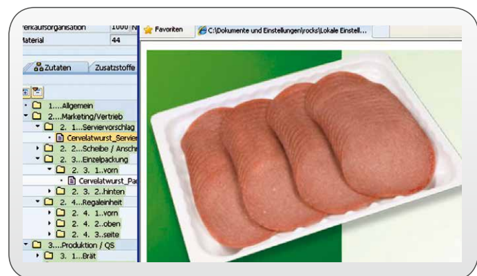
Von jeder Fachabteilung werden die Informationen zentral gepflegt und stehen somit allen mit Änderungsbeleg und Exportfunktion zur Verfügung.

In dieser einen zentralen Datenbank stehen Ihre Produktstammdaten jederzeit allen Stellen im Unternehmen zur Verfügung, die auf die Datenbank zugreifen wollen oder Daten liefern müssen - und zwar vollständig, zuverlässig und immer aktuell. So geben die jeweiligen Fachabteilungen beispielsweise Zutaten, Zusatzstoffe, Nährwerte, Allergene, Mikrobiologie, Infos zu Chemie/Physik oder Sensorik, Produktinfos, Sortimente, Langtexte oder Bilder ein. Davon profitieren Sie zum Beispiel bei der Erstellung von Angeboten und Auswertungen, in Onlinekatalogen, dem Etikettendruck sowie unter anderem an den Preisauszeichner- und Verwiegestationen.